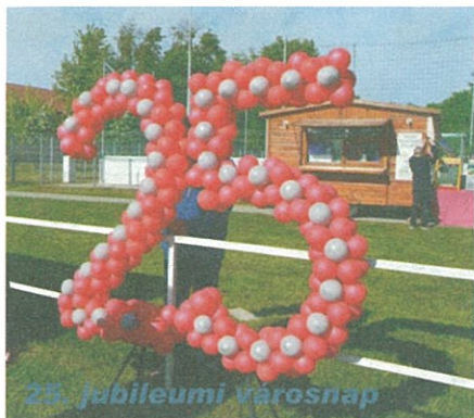
25. jubileumi városnap

A színpompás májusfák nemcsak a szerelmet hirdetik Tégláson május elsején, hanem a város napját is. Kiemelt, jubileumi ünnepnap volt 2016-ban a városnap, hiszen önálló várossá válásunknak 25. jubileumi évfordulóját ünnepeltük.