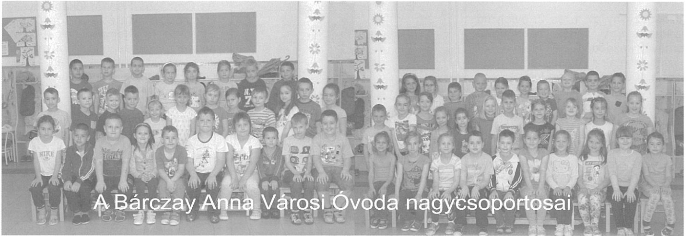
A Bárczay Anna Városi Óvoda nagycsoportosai